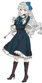
“金剛の要塞”アーメ ンガード×1(※)