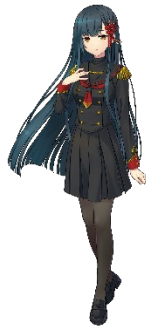
“言霊の鬼姫” コトハ×1(※)