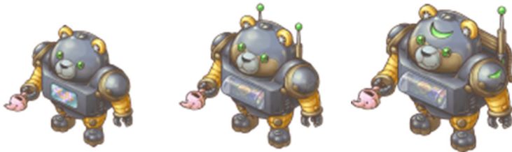
(画像は左から、くまさんロボ, Mk-II, HYPER)