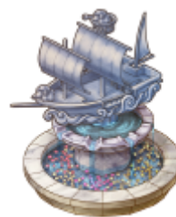
▲海洋ロマンな噴水