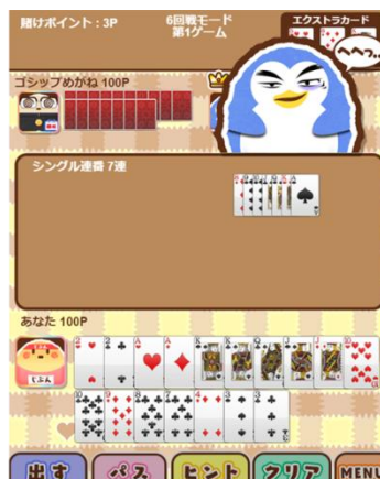
マハラジャ Maharaja 闘地主