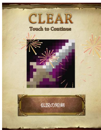
お絵かき パズル 1000!

誰でも気軽に楽しめるカジュアルゲームを、今後も続々追加いたしますので、続報をお待ちください。